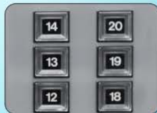
エレベーターのボタン