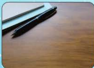
カウンターやデスクの上