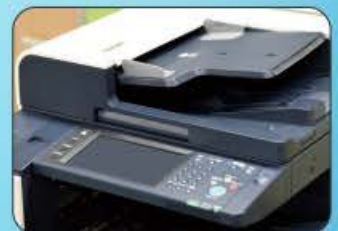
コピー機のパネルやカバー